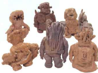
「怪獣アベンジャーズ」 岡本 直樹