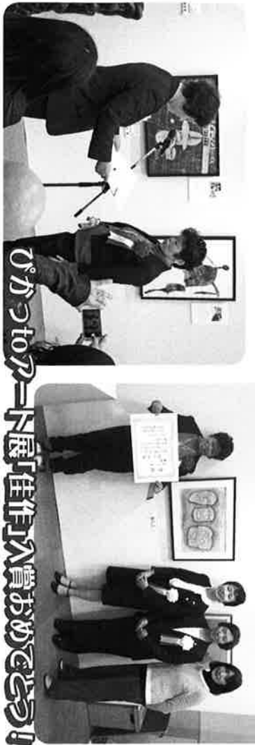
ひかりホール 入賞おめでとう

しが本人の会なかよし会 会長あいさつ 本日は、お忙しい所、第10回本人の会交流会にご参加いただきありがとうございます。私、1月2月は、冬本番寒ぞで今年も滋賀県にも大雪が降り、あちこちで事故も発生しましたが3月になり気温が上がりやすくなり季節になりました。今年はこのところ立派な甲南公民館で開催することができ、みなさんと出逢えたいことを大変うれしく思います。短い時間ですが楽しい交流会にしていきますよう。