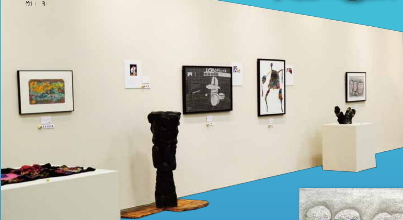
第6回「ぴかっとアート展」(2016年) イオンモール草津イオンホール会場風景